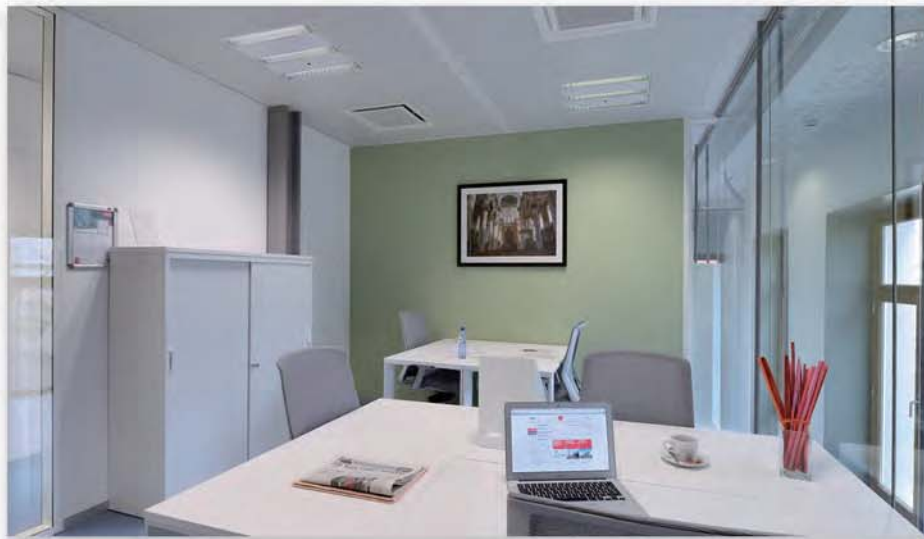
第1ターミナルビル3F

レンタルオフィススペースを1時間単位でご利用いただくことも可能です。ちょっとした時間に集中してお仕事したい時や、商談、面接など個室の空間を一時的に利用したい時など、便利にご利用いただけます。